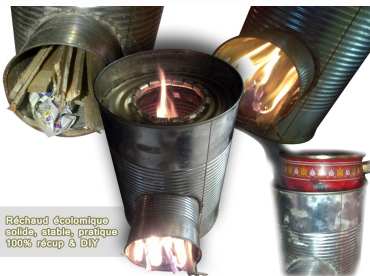
Réchaud écologique solide, stable, pratique 100% récup & DIY